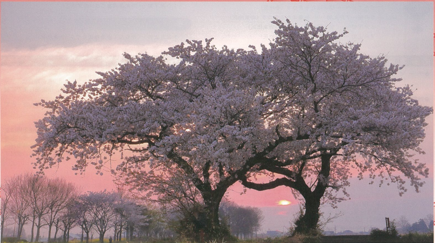
2017年巻・岩室温泉郷観光写真コンテスト 最優秀賞「春霞」