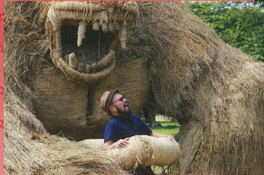
新潟市長賞「ゴリラとヒゲオヤジ」