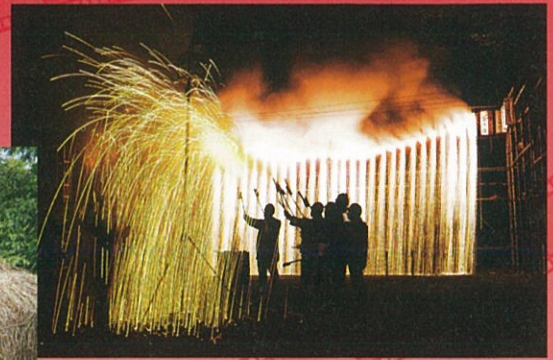
岩室温泉観光協会会長賞「ナイヤガラ」