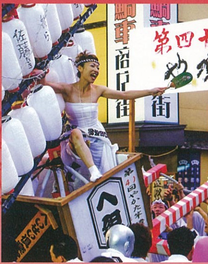
巻観光協会会長賞「竿燈でワッショイ」